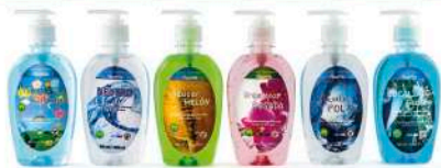
ALCOHOL EN GEL 300ml.