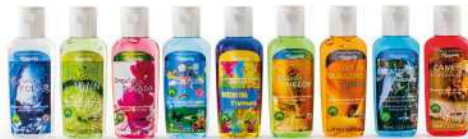
ALCOHOL EN GEL 70ml.