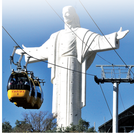
IMAGEN: CRISTO DE LA CONCORDIA - CBBA

Desde su fundación, COBOCE ha acompañado al progreso de la región y del país, se puede ver este aporte en las casas, edificios, calles, avenidas, distribuidores y en obras importantes como el aeropuerto, Cristo de la Concordia y carreteras interprovinciales e interdepartamentales o la Bioceánica. COBOCE está presente en todas partes del país aportando con un producto de calidad hecho por bolivianos para los bolivianos.