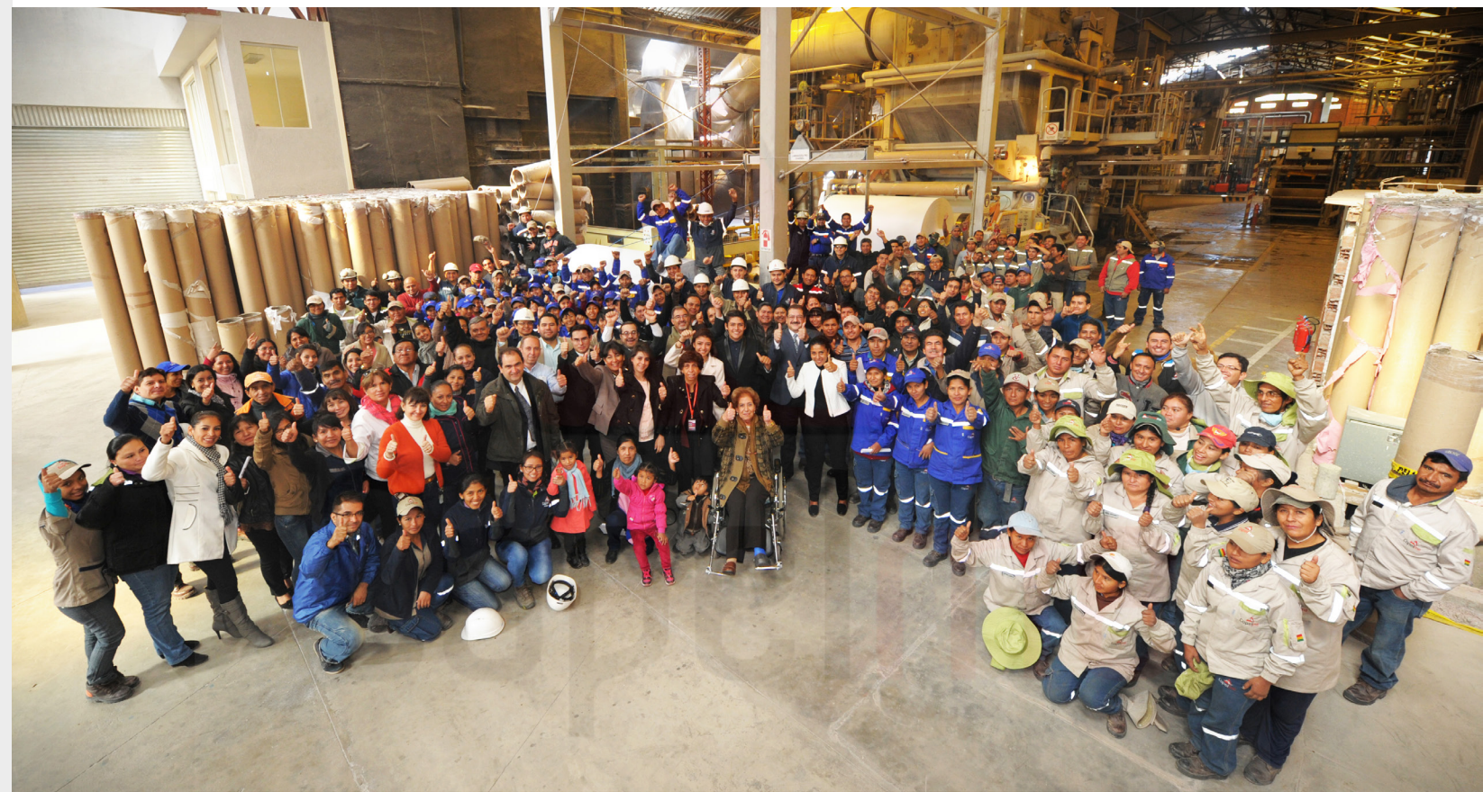
IMAGEN: PERSONAL - COPELME S.A

(RECME) de la parte productiva, como unidades de negocio descentralizadas y con autonomías de gestión. Ser una empresa cien por ciento boliviana es un valor y un compromiso que ha permitido a COPELME enfrentar a competidores internacionales, la población boliviana ha respondido con su preferencia a la gama de productos que tiene a su disposición, permitiendo un crecimiento sostenido al que muy pocas empresas aspiran en el país.