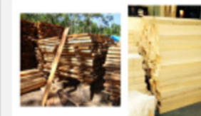
TABLA DE SUSHI Y FIAMBRES