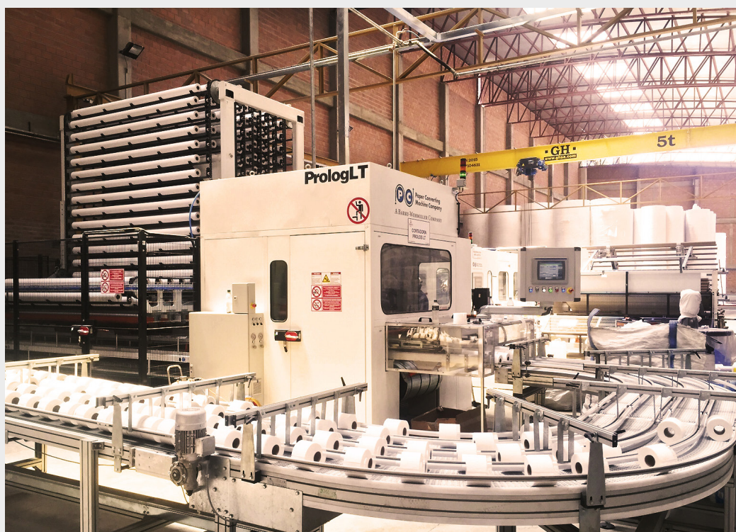
IMAGEN: PLANTA DE PRODUCCIÓN DE PAPEL - COPELME S.A

COPELME cuenta con personal altamente calificado para desempeñarse en la atención de cada uno de sus procesos, es un equipo humano que ha adoptado la filosofía de mejora continua (buenas prácticas de manufactura, 5Ss, etc.), y que responde plenamente a los objetivos de la empresa. Las inversiones realizadas entre 2012 y 2015 potenciaron su capacidad productiva, ello permitió sumarse a las nuevas tendencias y preferencias del mercado tradicional e incursionar en nuevos segmentos a los que antes no se había atendido. Los esfuerzos se enfocaron en la producción de papel blanco y papel de color natural o neutro para los segmentos tradicionales y en base a la fibra importada se comenzó la producción de papel blanco de alta gama para ingresar en la preferencia de un nuevo segmento de mercado.