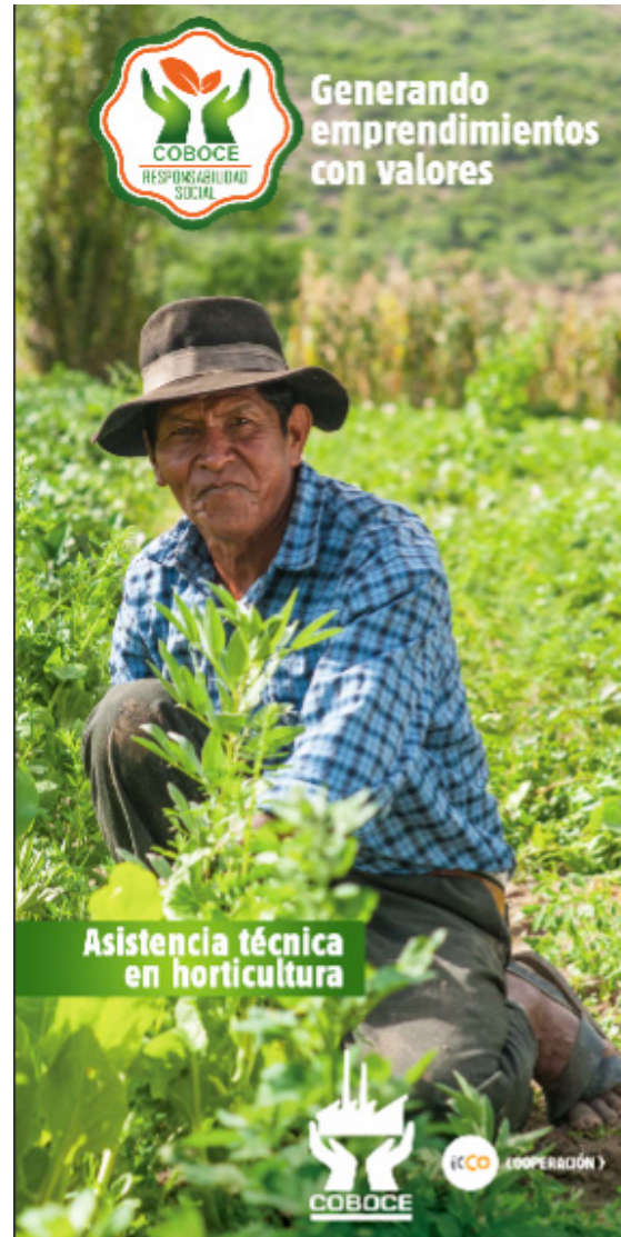
IMAGEN: RESPONSABILIDAD SOCIAL - COBOCE LTDA.

Considerando el éxito de los programas de Responsabilidad Social, COBOCE determinó expandir su área de acción hacia Sacaba, un municipio que es sede de una de sus siete unidades productivas, Coboce Cerámica. Una de las obras sociales que está en proceso de consolidación es la construcción de una escuela de gastronomía donde no solo formará chefs sino también un restaurante donde los estudiantes puedan poner sus conocimientos en práctica.